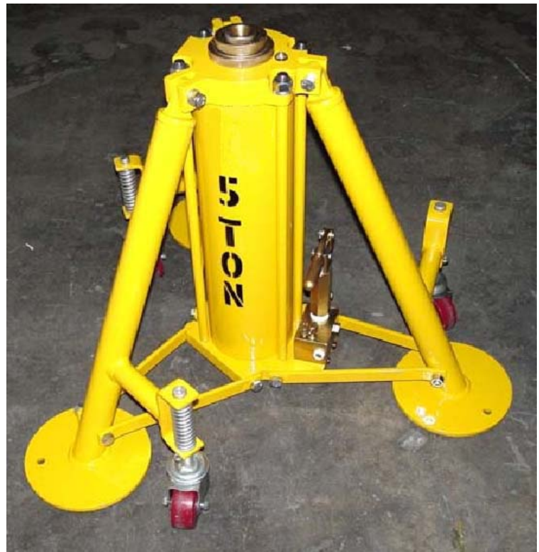
多目的型 2ステージ 三脚型ジャッキ 仕様