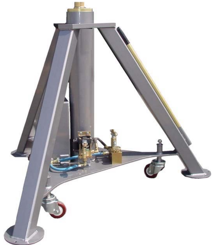
固定高さ 三脚型ジャッキ 仕様