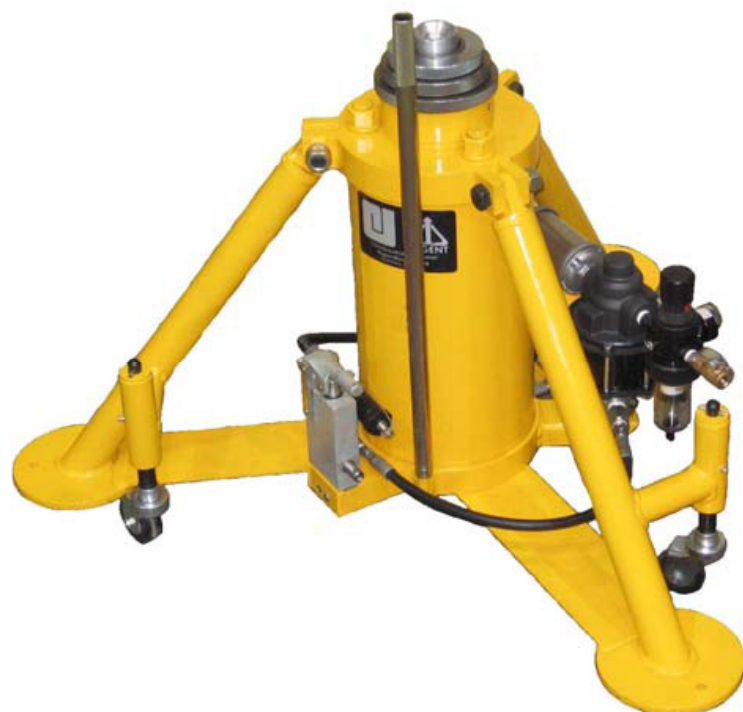
多段型三脚型3ステージジャッキ仕様書